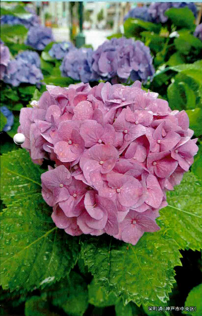
栄町通(神戸市中央区)